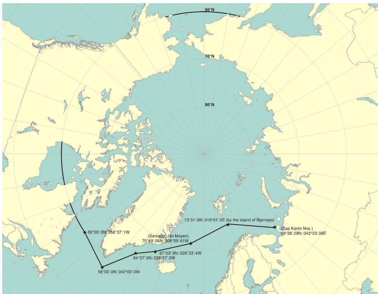
Figura 2: Extensión máxima del ámbito de aplicación en aguas árticas 3